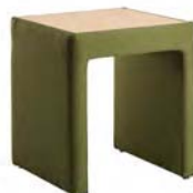
8000 T A : 17" C : 18 1/2"