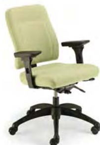
8001 A : 20" C : 17 - 21" E : 18 1/2"