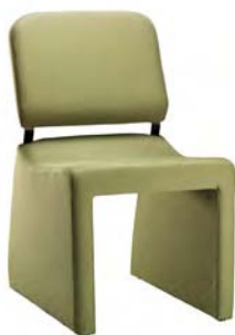
8000 A : 20" C : 19" E : 17"