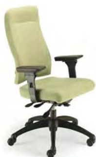
8002 A : 20" C : 17 - 21" E : 24"