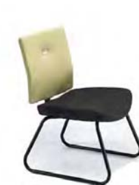
VTM2T A : 19 1/2" C : 18 1/2" E : 19"