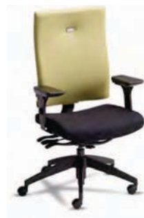
VTM3 A : 19 1/2" C : 17 - 22" E : 23"