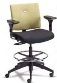
VTM1-DSN A : 19 1/2" C : 24 1/2 - 34 1/2" E : 19"