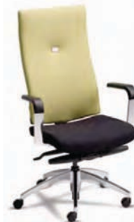
VTM4 A : 19 1/2" C : 17 - 22" E : 27"