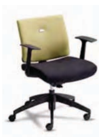
VTM1 A : 19 1/2" C : 17 - 22" E : 15"