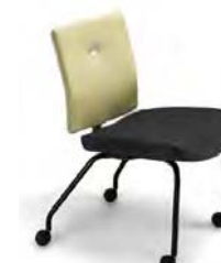
VTM2R A : 19 1/2" C : 18 1/2" E : 19"