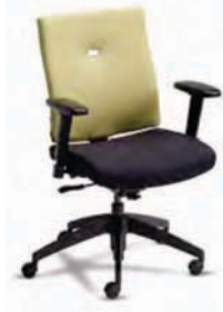
VTM2 A : 19 1/2" C : 17 - 22" E : 19"