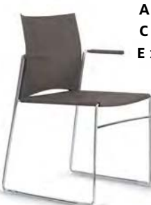
76-6 A : 17 1/2" C : 18 1/2" E : 15 1/2"