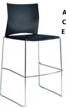
175-1 A : 17 1/2" C : 27 1/2" E : 15 1/2"