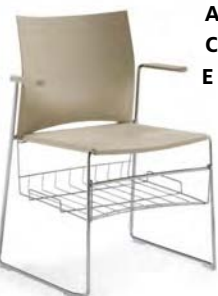
76-7 A : 17 1/2" C : 18 1/2" E : 15 1/2"