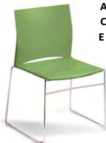
75-5 A : 17 1/2" C : 18 1/2" E : 15 1/2"