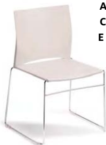
75-3 A : 17 1/2" C : 18 1/2" E : 15 1/2"