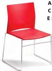
75-2 A : 17 1/2" C : 18 1/2" E : 15 1/2"