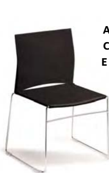
75-1 A : 17 1/2" C : 18 1/2" E : 15 1/2"