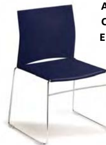
75-4 A : 17 1/2" C : 18 1/2" E : 15 1/2"