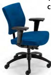
L9001 A : 20 1/2" C : 17 - 21" E : 17"