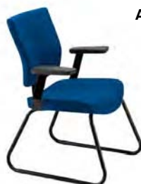
L9001 T A : 20 1/2" C : 18" E : 17"