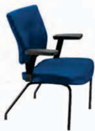
L9001 P A : 20 1/2" C : 18" E : 17"