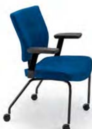
L9001 PR A : 20 1/2" C : 18" E : 17"