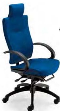
L9003 A : 20 1/2" C : 17 - 21" E : 29"