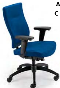
L9002 A : 20 1/2" C : 17 - 21" E : 23"