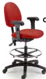
1880 DSN A : 17" C : 21 1/2 - 31 1/2" E : 15"