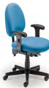
1990 A : 19" C : 17 - 22" E : 18"