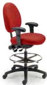
1990 DSN A : 19" C : 22 - 32" E : 18"