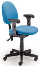
1880 A : 17" C : 16 - 21" E : 15"