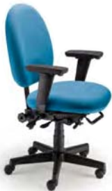
1992 A : 19" C : 17 - 22" E : 20"