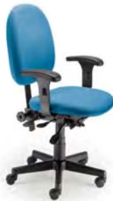
1882 A : 17" C : 16 - 21" E : 19"