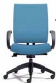
FIR3 A : 19 1/2" C : 16 3/4 - 22 1/2" E : 21 1/2"