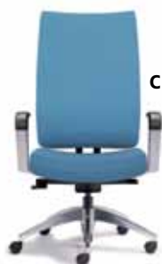
FIR4 A : 19 1/2" C : 16 3/4 - 22 1/2" E : 24 1/2"