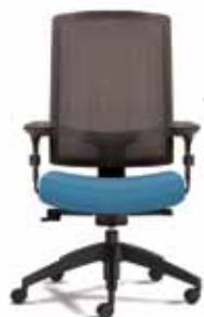
FIM3 A : 19 1/2" C : 16 3/4 - 22 1/2" E : 23 1/2"