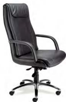
702 A : 21" C : 18 - 22" E : 27 1/2"