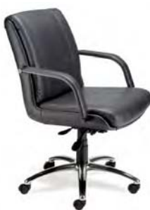
701 A : 21" C : 18 - 22" E : 20 1/2"