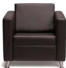
2001 A : 31" C : 18" E : 17"