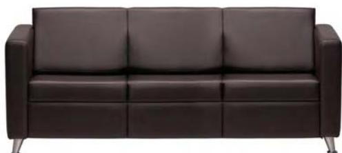
2003 A : 75" C : 18" E : 17"