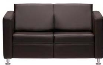
2002 A : 53" C : 18" E : 17"